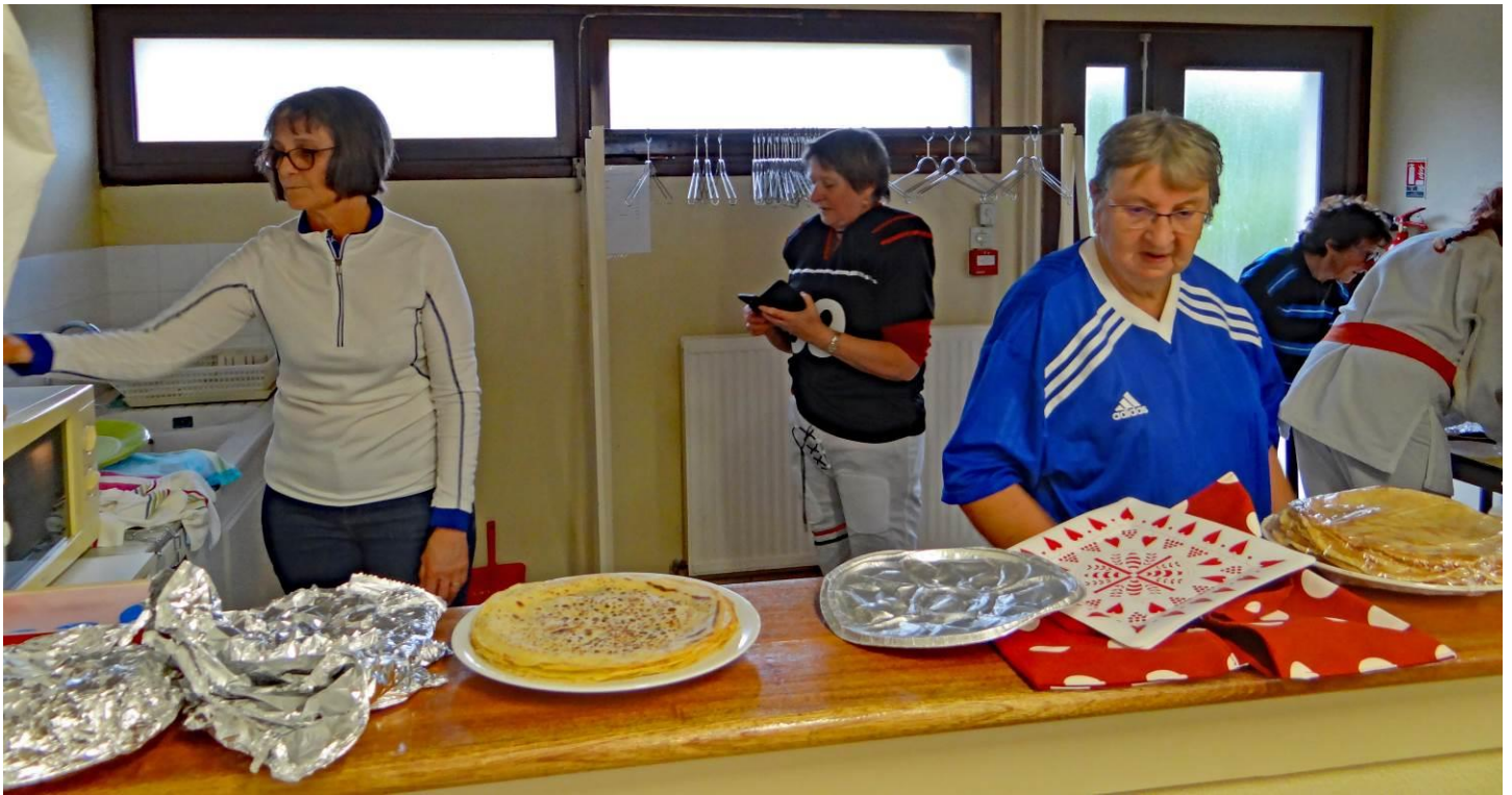
On s'active à la cuisine avant d'accueillir les sportifs