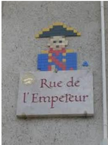
Rue de l'Empereur, à une extrémité et à l'autre