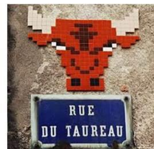
Bien peu parmi nous devaient connaître cette rue