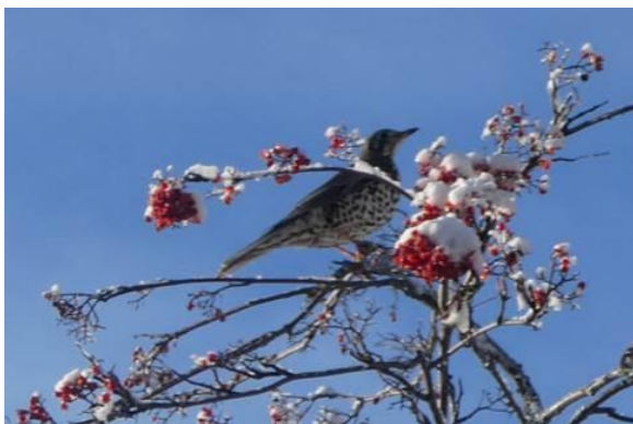
Grive musicienne