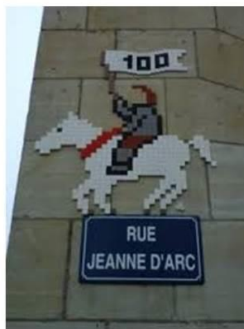
Et la centième, créée récemment

Ces images, nous sommes passés devant des dizaines de fois, mais nous marchons rarement le nez en l'air !