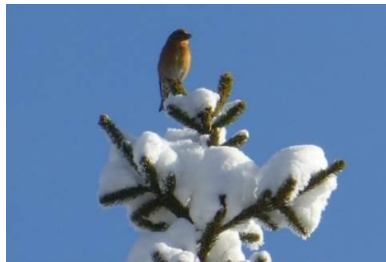
Bec croisé